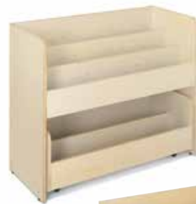
Anette fås i hvid laminat samt birk eller bøg.